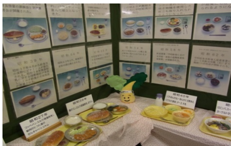
学校給食の歴史コーナー

*「子どもアドベンチャー」は、夏休みを体験学習等の一つの機会ととらえ、キャリア教育の視点から、市内在住の小・中学生等を対象に、市役所をはじめとするさまざまな仕事を見学・体験できる事業です。