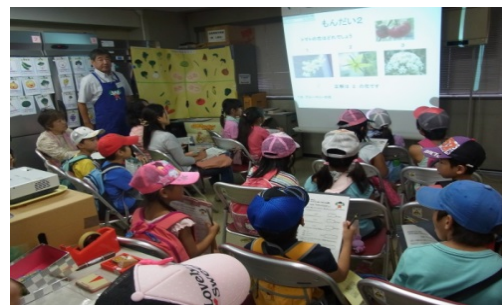
野菜のお話コーナー