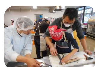
1 7月25日 〔生揚げと豚肉の みそ炒め〕