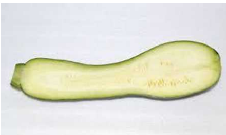
ズッキーニの断面↑