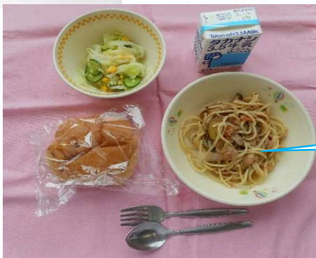
夏野菜のスパゲティ