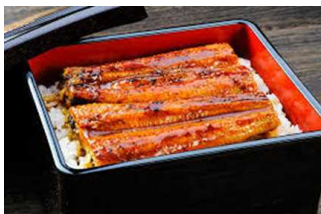
うなぎのかばやき

うり… きゅうり、すいか、とうがん、かぼちゃ、にがうりなど瓜類は夏が旬の野菜です。夏野菜の特徴として体内の余分な熱を冷ます働きがあります。