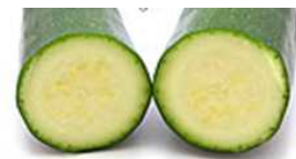
ズッキーニを輪切りにした断面↑