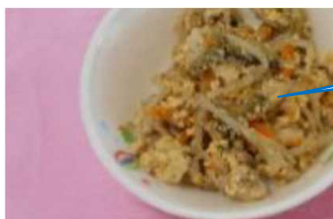
ゴーヤチャンプルー