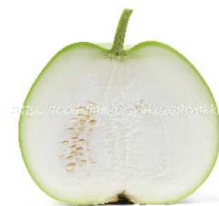
ゆうがおの実の断面図

98パーセントの生産量を誇る、栃木の伝統食材です。夏から秋にかけてとれる、ゆうがおの実をひも状に裂いて天日で干したものです。江戸時代から作られていました。すしのかんぴょう巻きに使われるイメージが強い乾物ですが、給食では、かんぴょうのソテー、五目ずしの具、甘酢あえなどにも使ってます。 (とちぎの百様 参照)