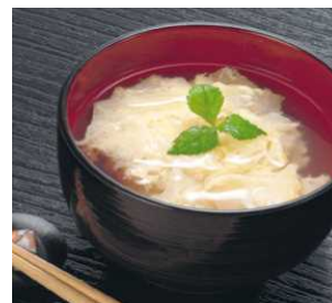
<かんぴょうの卵とじ>