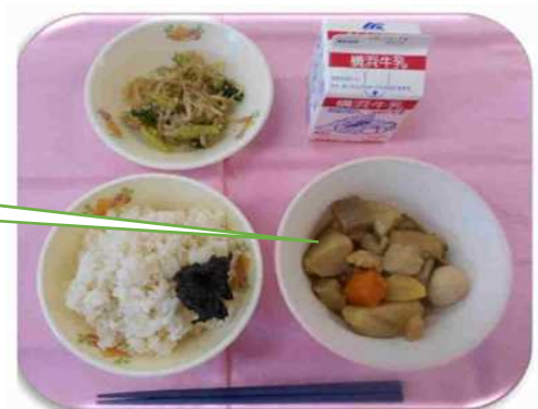
さつまいもと栗の甘煮 栗名月と呼ばれる十三夜の頃に給食では提供しています。