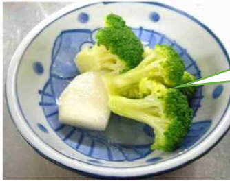
野菜の色が鮮やかな かぶとブロッコリーのサラダ