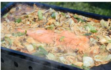
<ちゃんちゃん焼き>

鮭などの魚と野菜を鉄板で焼いた北海道石狩地方の郷土料理です。ちゃんちゃんの名前の由来は、ちゃっちゃと早くできる、出来上がるのが待ちきれず、はしで食器を叩いた音からきたなど諸説あります。