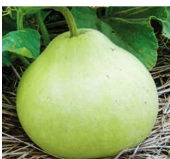
6~7Kgもあるゆうがおの実