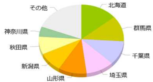
2017年 枝豆の主な産地と収穫量