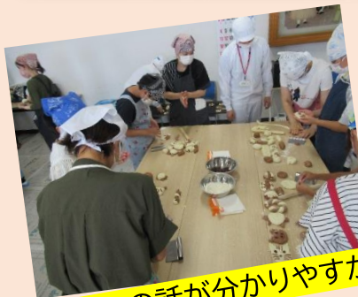
パンの話が分かりやすかった!