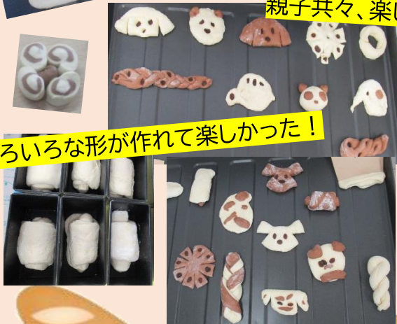
いろいろな形が作れて楽しかった！