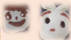
スタッフの人が優しくった。