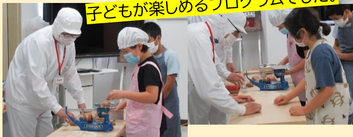
子どもが楽しめるプログラムでした。