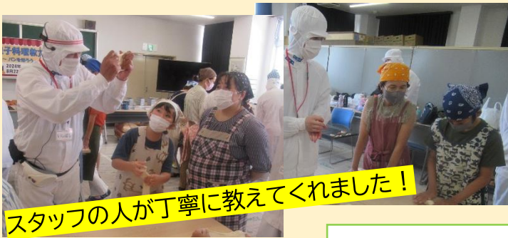
スタッフの人が丁寧に教えてくれました!