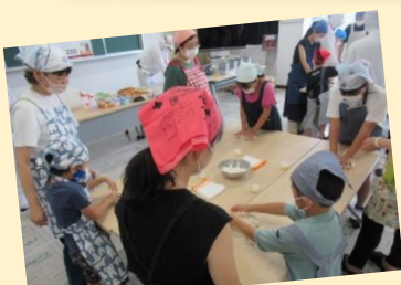
スタッフと一緒に安心して作業ができた。