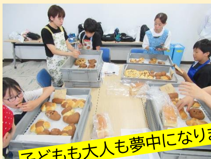
子どもも大人も夢中になりました。