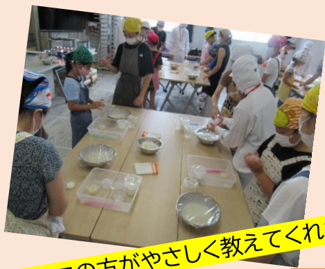
スタッフの方がやさしく教えてくれました！