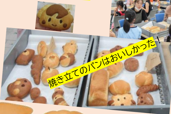
焼き立てのパンはおいしかった！