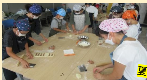
夏休みの一番の思い出です!