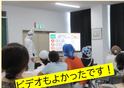
ビデオもよかったです!