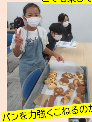
パンを力強くこねるのが大変でした。