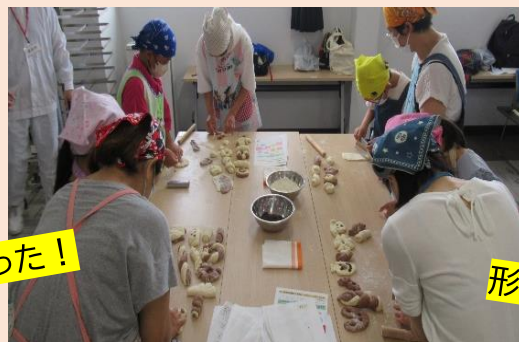
形を作るのが楽しかった!