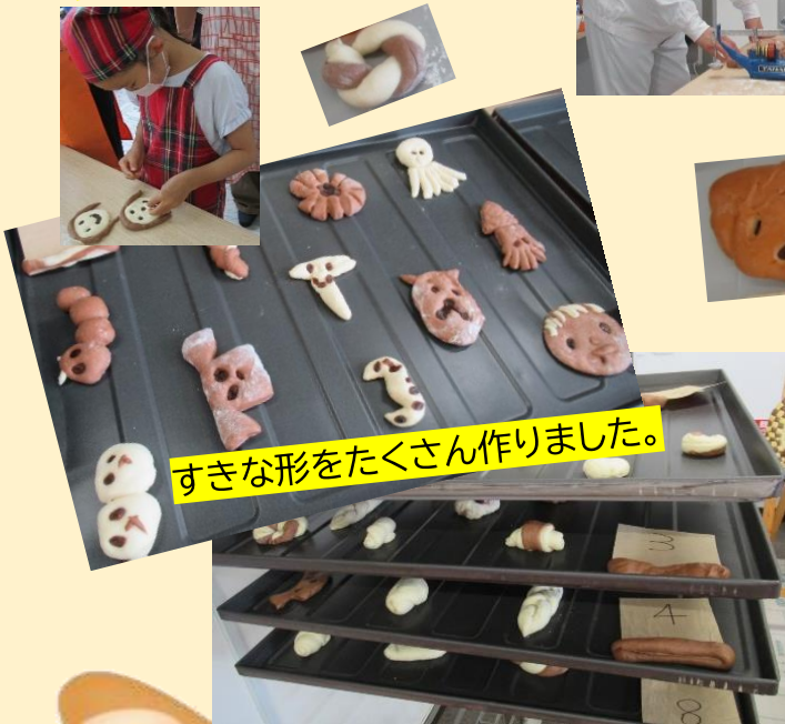
すきな形をたくさん作りました。