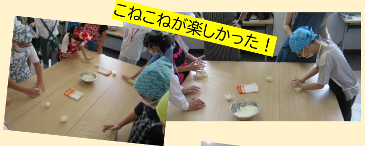
こねこねが楽しかった!