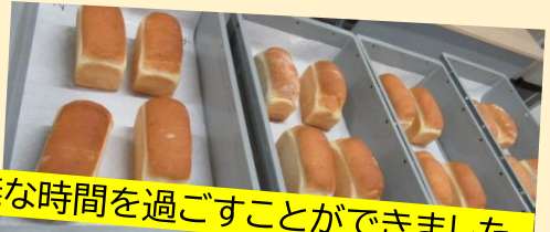
有意義な時間を過ごすことができました。