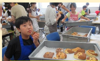
大好きなパンがより好きになりました。