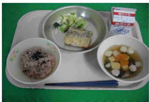
昨年は50周年をお祝いして 「トウキノコ汁」(豆腐ときのこ)を 出しました！