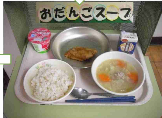
お話に出てくるスープが給食に出るといことでみんなワクワク・・・ 主菜も洋風に合わせて「まぐろのガーリックソース」を作りました。