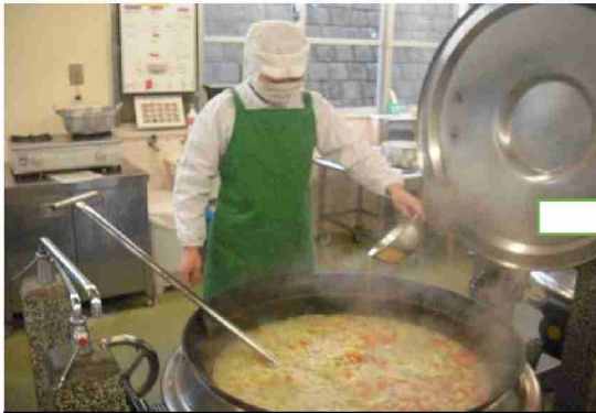
最後にバターも入れて・・・♪