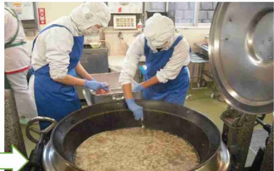
スープの中にお肉のおだんごをひとつひとつ入れていきます。