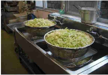
スープに入れる野菜を切ります。 (にんじん・たまねぎ・じゃがいも・キャベツ)