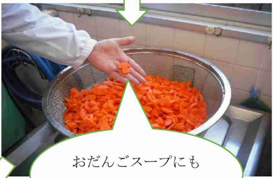
おだんごスープにも 「トウキノコ」が！