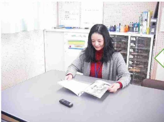
学校司書の先生による「おだんごスープ」の読み聞かせを給食時間に放送委員会が流しました。図書委員会は図書室で「おだんごスープ」の本を宣伝しました。