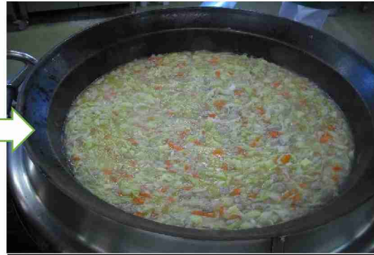
おばあさんの味そっくりな「おだんごスープ」ができました！！