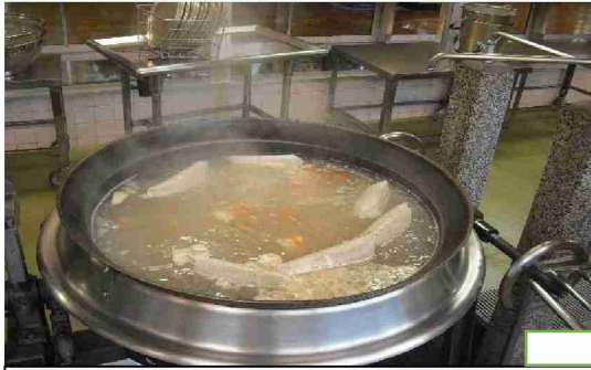
豚骨でスープを取ります。