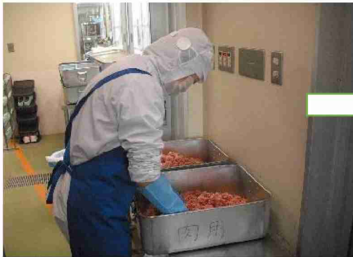
豚ひき肉を練って肉団子を作ります。