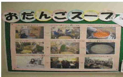
「おだんごスープ」を作っている様子を給食室前に掲示しました。