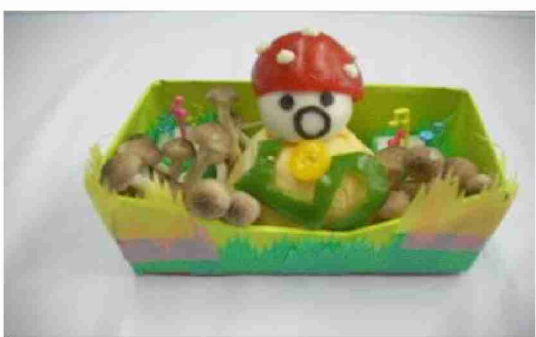
食材で「トウキノコ」を再現！（掲示用）