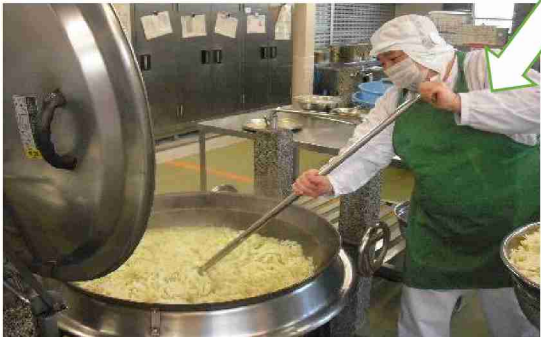
給食用にはキャベツもたっぷり！！