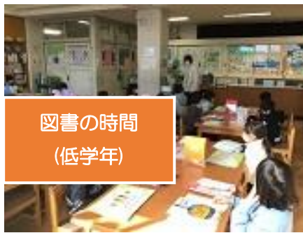
図書館の時間 (低学年)