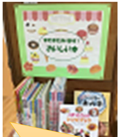
貸し出し用のおすすめ本を紹介したコーナー