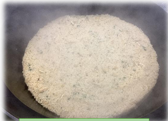
だいこんごはんが炊けました！