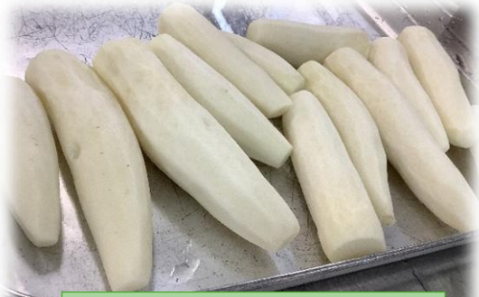
農園のだいこんを使って だいこんごはんを作りました！