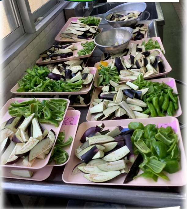
夏の給食室は 40℃位になります・・・