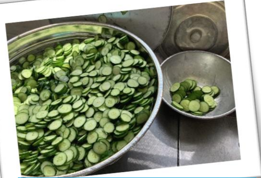
小さいボールは農園のきゅうりです