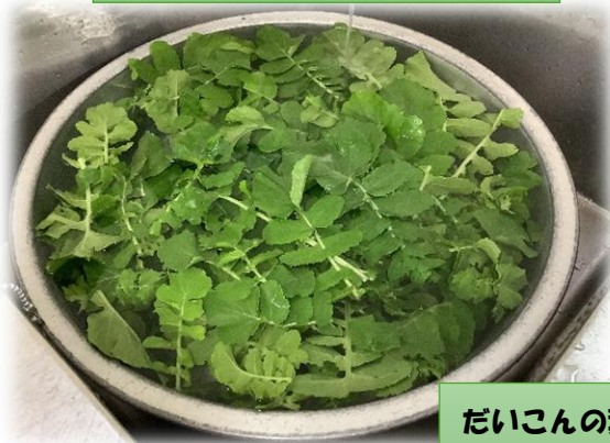
だいこんの葉もごま油で炒めて ごはん炊きに混ぜました！