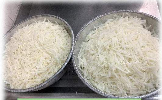
千切りのだいこんと油揚げを ごはん炊きに炊き込みます！