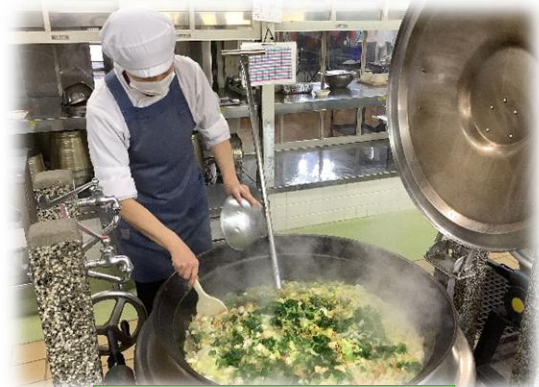
農園野菜いっぱいの 山元農園鍋もできました！